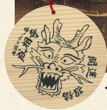
◀ 開運上昇祈願 龍の絵馬